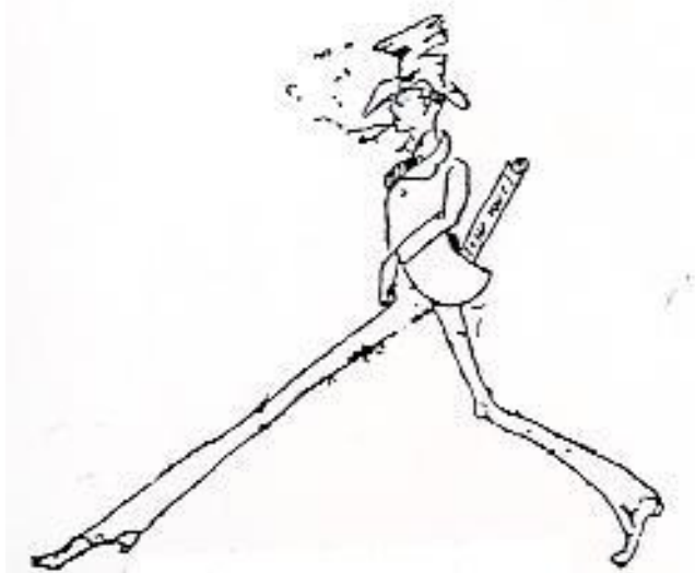
Ernest Delahaye Le Nouveau Juif errant