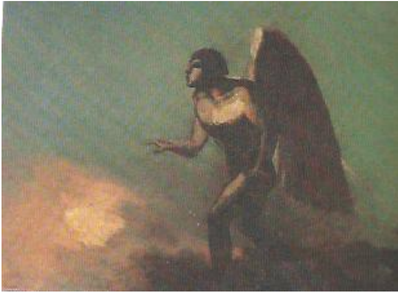
Odilon REDON (1840-1916) L'homme ailé ou L'ange déchu